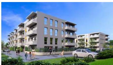
Leszno Os. Grono