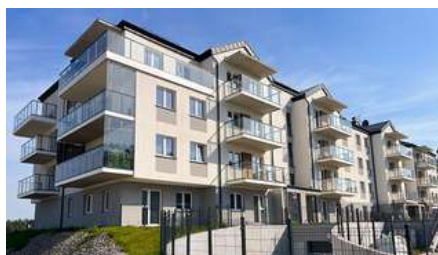
Gdańsk Ul. Pastelowa