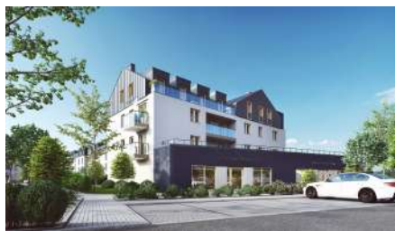
Zabłudów Os. Kalwinówka