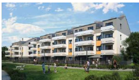
Wrocław Al. Platanowa