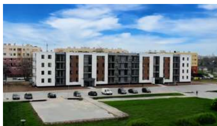
Jawor Ul. Słowiańska