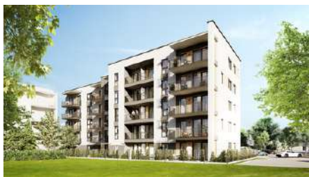
Tychy Harcerska 8